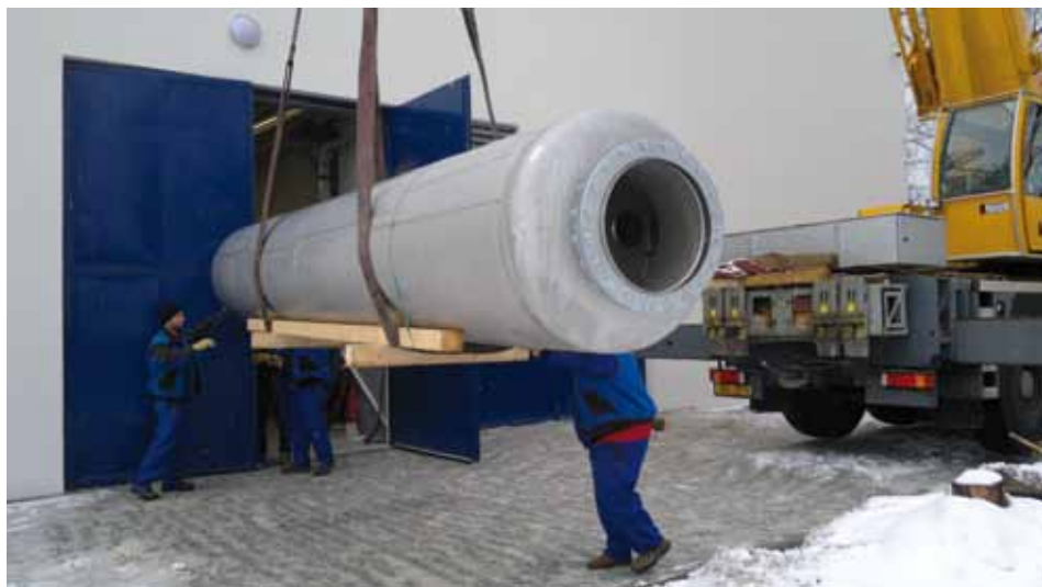
Přesun jednotlivých částí dovnitř nové kotelny si vyžádalo těžkou techniku.