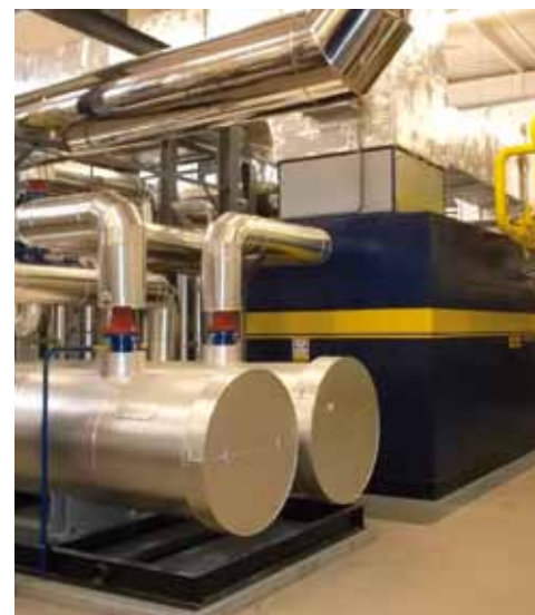
Celkový pohled do nově zrekonstruované kotelny na sídlišti Františkov (nahofe) a nová kogenerační jednotka v protihlukovém rámu (vlevo).

Práce na uvedení celé jednotky do provozu pokračovaly podle harmonogramu a na konci března byla kogenerační jednotka připravena na provozní zkoušky. Pokud nedojde k žádným neočekávaným komplikacím, tak bude v dubnu motor ve zkušebním režimu, který by měl v průběhu června přejít do trvalého provozu. Nově se tak bude na libereckém sídlišti Františkov vyrábět elektrická energie v moderní kogenerační jednotce.